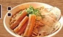
味噌メンマらーめん 900円