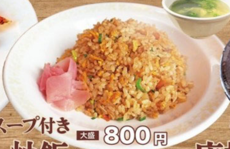
中華スープとセット スープ付き 炒飯 大盛 800円 並 650円