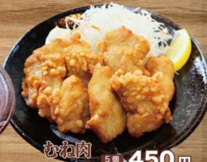
むね肉 5個 450円 唐揚げ 8個 600円