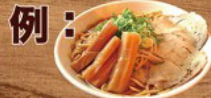
例： 味噌メンマらーめん 900円