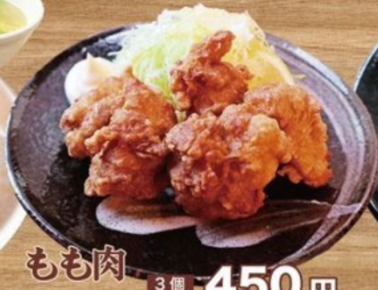
もも肉 3個 450円 唐揚げ 5個 600円